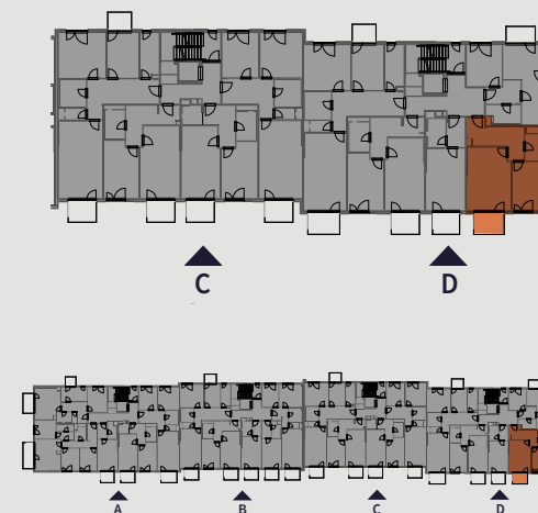
Pohled na dům | Building View