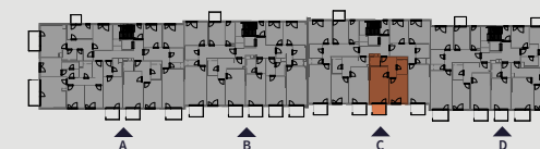
Pohled na dům | Building View