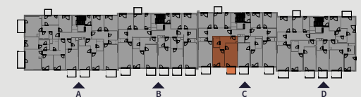
Pohled na dům | Building View