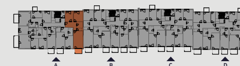
Pohled na dům | Building View