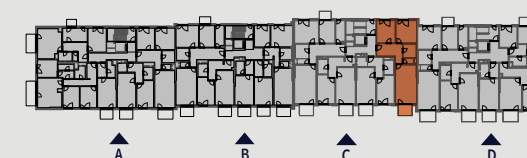
Pohled na dům | Building View