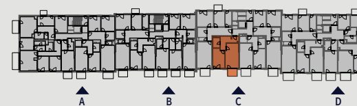
Pohled na dům | Building View