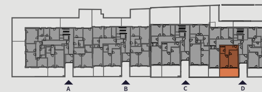
Pohled na dům | Building View