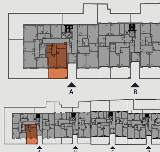
Pohled na dům | Building View